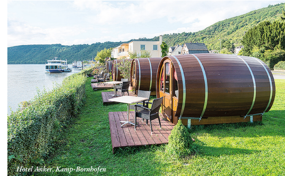
Hotel Anker, Kamp-Bornhofen