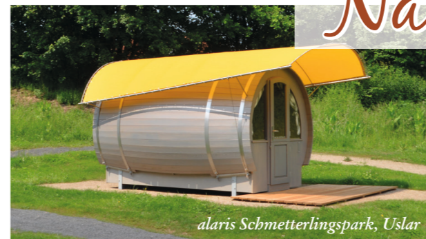
alaris Schmetterlingspark, Uslar