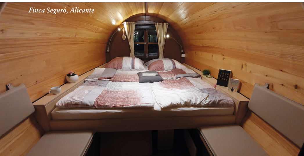
Finca Seguró, Alicante

In unserer Tischlerei wird mit höchstem handwerklichen Können jede Daube (Brett in der Außenwand) zu den Enden hin verschmälert, die Seiten angeschrägt und mit Nut & Feder versehen. So entsteht ein wirklich bauchiges Fass mit viel Platz im Innenraum. Gewähr für viele, viele Jahre Spaß am Fass – für welche Variante Sie sich auch entschieden haben.