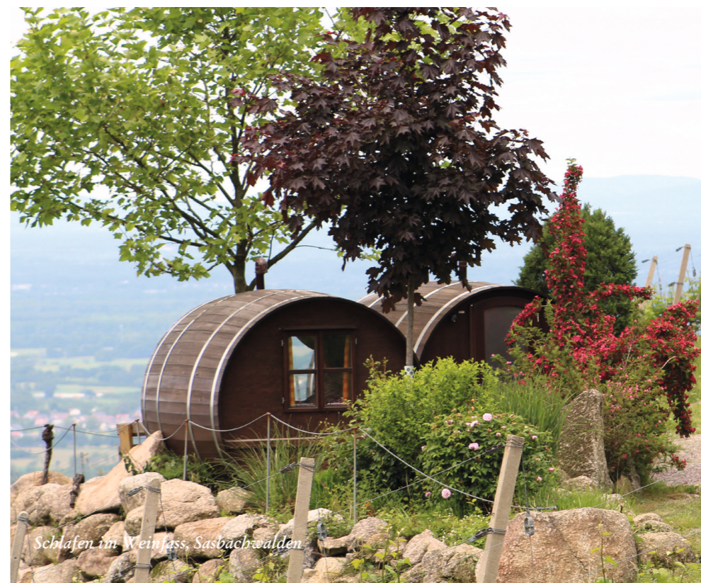
Schlafen im Weinfass, Sasbachwälden