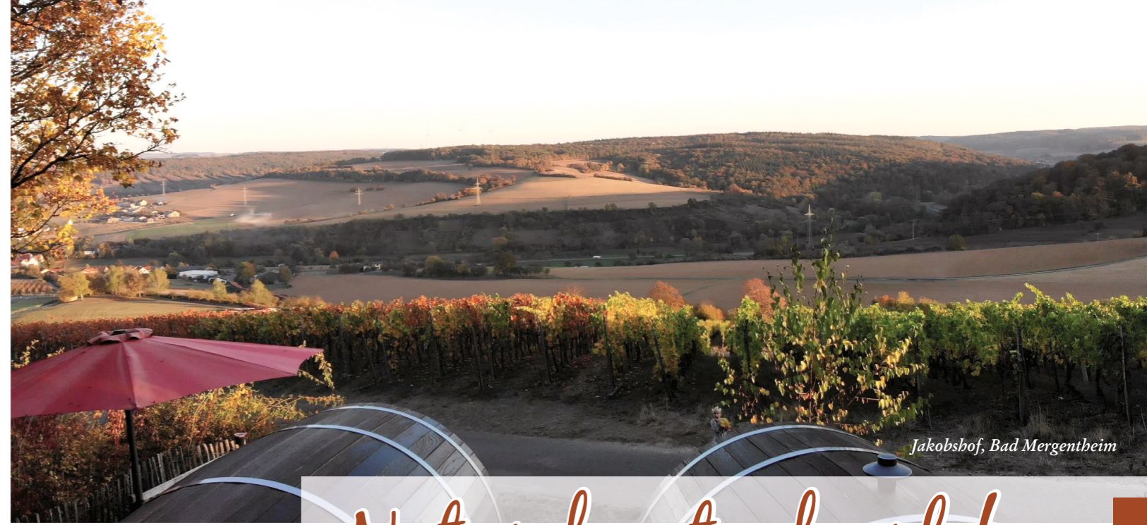
Jakobshof, Bad Mergentheim