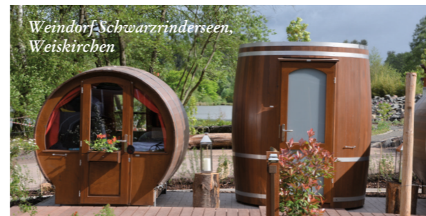
Weindorf Schwarzerden, Weiskirchen